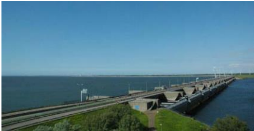
De Haringvlietsluizen

Wanneer goed ingespeeld wordt op deze veranderingen, kan het G-O een krachtige economische impuls opleveren.