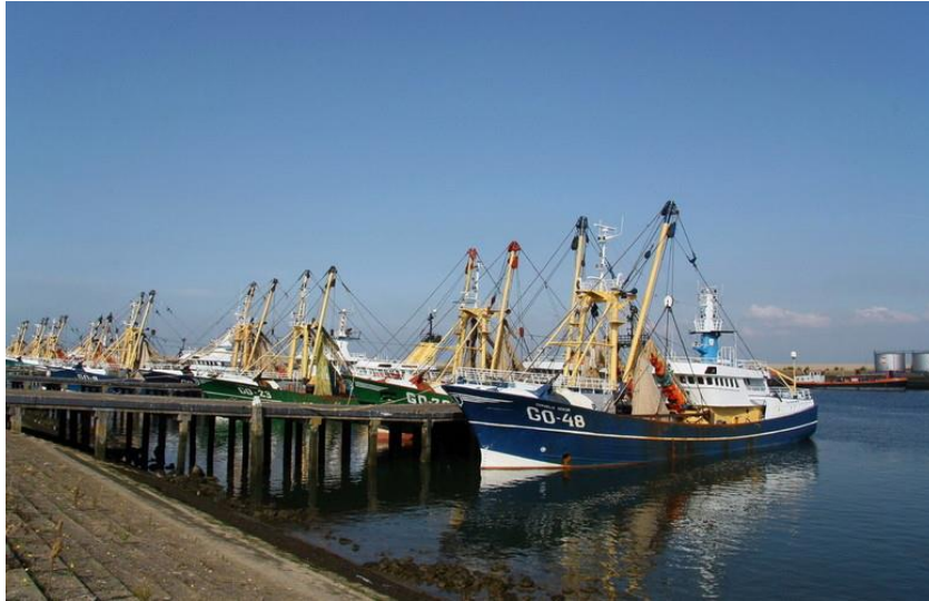
De vissershaven van Stellendam

Ondanks de rust en ruimte die G-O kenmerkt, is de afstand tot de zuidelijke Randstad (regio Rotterdam) kort, door de verbindingen via de N57 en N59.