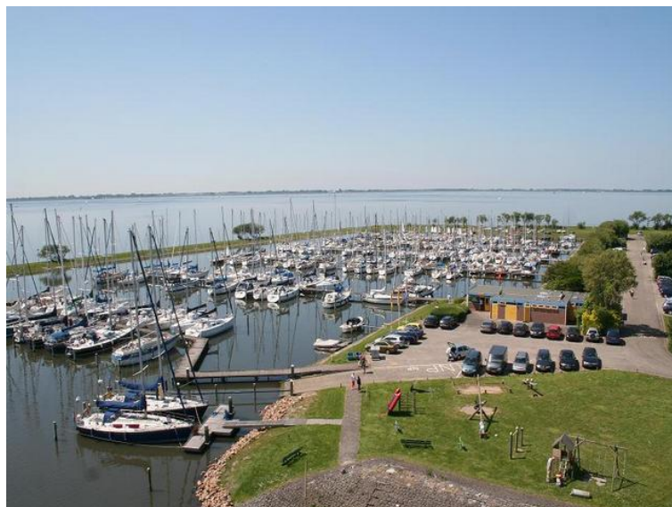
De jachthaven van Herkingen aan de Grevelingen

Door hun ligging aan water is de visserij voor de drie dorpen van aanzienlijk economisch belang geweest. Daarnaast zijn vooral Herkingen en Ouddorp ook agrarische gemeenschappen. Na de Tweede Wereldoorlog is er op G-O een belangrijke economische activiteit bijgekomen: het toerisme. Ouddorp heeft zich vanaf de jaren '70 ontwikkeld tot recreatieve trekpleister, als badplaats en als hét uitgaanscentrum van de regio. Voor Herkingen is de ligging aan het Grevelingenmeer essentieel; het dorp heeft een eigen jachthaven en profileert zich graag als watersportplaats.