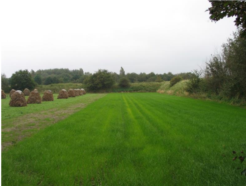
Schurvelingenlandschap bij Ouddorp

Door hun ligging aan water is de visserij voor de drie dorpen van aanzienlijk economisch belang geweest. Daarnaast zijn vooral Herkingen en Ouddorp ook agrarische gemeenschappen. Na de Tweede Wereldoorlog is er op G-O een belangrijke economische activiteit bijgekomen: het toerisme. Ouddorp heeft zich vanaf de jaren '70 ontwikkeld tot recreatieve trekpleister, als badplaats en als hét uitgaanscentrum van de regio. Voor Herkingen is de ligging aan het Grevelingenmeer essentieel; het dorp heeft een eigen jachthaven en profileert zich graag als watersportplaats.