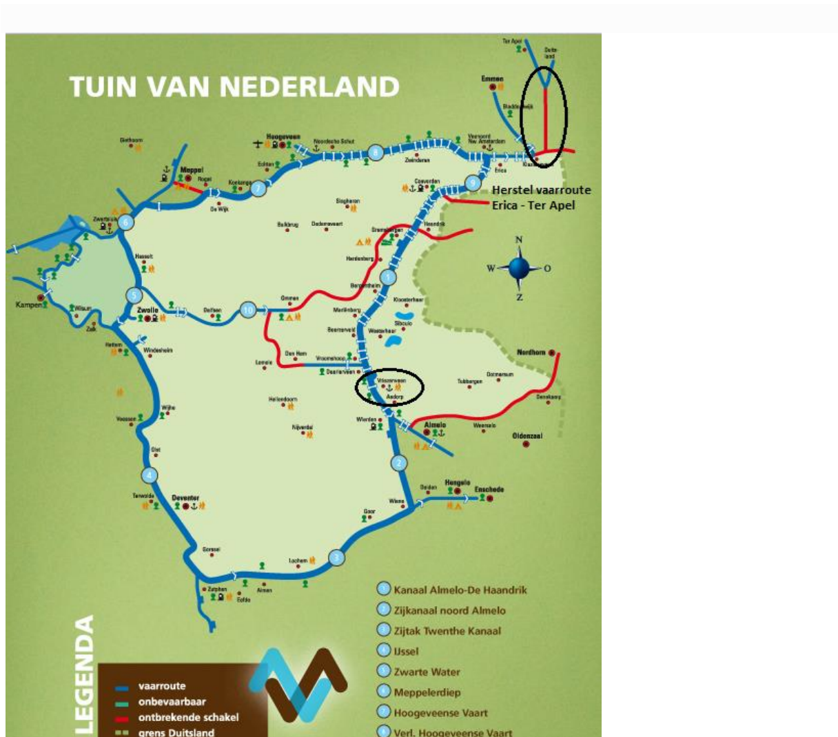
Vaarwegen in Overijssel en Drenthe